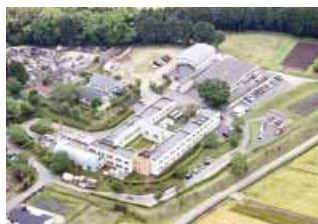
「障がい者支援施設 三気の里」 大津町大字森54-2 昭和62年5月1日開所 入所者数66人 平均年齢46.1歳