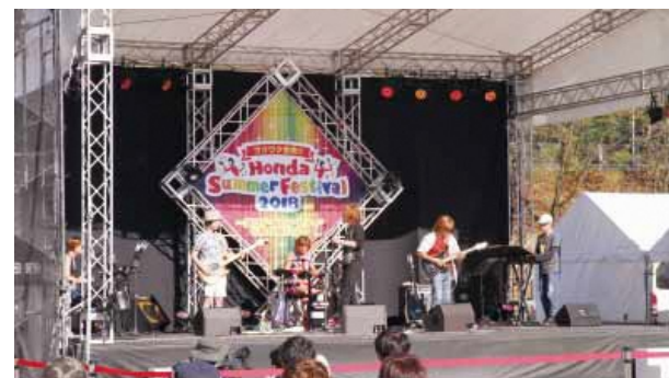
さまざまなステージイベントが祭りを盛り上げます

飲食店などの出店をはじめ、音楽ステージイベントや、同社のバイクの展示などが行われ、会場は大賑わい。祭り終了時には会場内で花火も上がり、観客の大歓声とともに幕を閉じました。