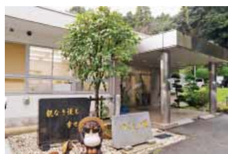
「障がい者支援施設 つくしの里」 大津町大字平川400 平成3年8月1日開所 入所者数52人 平均年齢48.0歳

地域を大事にしようと思い、大津北小の児童に施設に来てもらい、障害について学習会をやっています。「頑張ってもできないことがあるのが障害」「一人では生きていけないから助け合って生きていく」ことを伝えています。開設して27年が経ち、入所者も高齢化し、多種多様な支援が必要になっていますが、これからも利用者の皆さんの社会参加を通して、障害福祉についてももっと伝えていきたいと思っています。