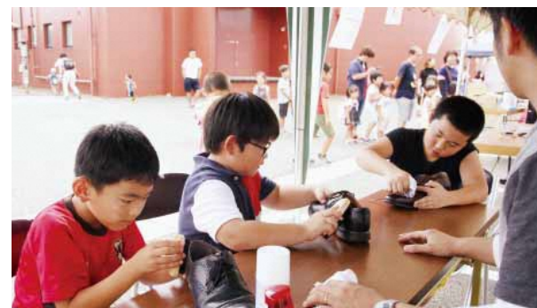
実際に店でやっている靴のメンテナンスを プロに教わりながら体験をする子どもたち

町内を中心に企業の参加があり、会場では靴屋体験として大人用の革靴を実際に磨いてみる体験や、歯科が実際に使う石膏を加工する体験などが行われました。