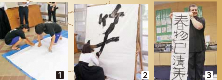
1障子紙を張り合わせて1枚の大きな紙を作ります2迫力あるパフォーマンス!! 3初めての書道に挑戦。初回にしては上出来と先生から褒めていただきました。

18年前から続く書道パフォーマンスは、部の伝統。繊細かつ力強い演技は、さまざまなイベントで多くの人たちを魅了しています。11月11日(日)の翔陽高校文化祭でも披露される予定です。