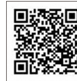
きっかけ割QRコード

※QRコードが読み込めないときはURLを入れてアクセスしてください。 http://ur0.work/Me15 (専用サイトから応募しないと、優待価格での購入が できませんのでご注意ください)。