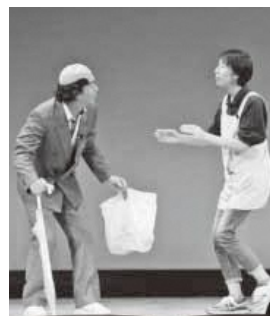
認知症の人への声かけを実践や寸劇を通して学びました