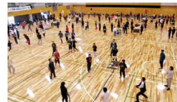
参加した皆さんはスポーツを通じたコミュニケーションを楽しんでいました

また、社員や家族からの熱い応援やお楽しみ抽選会も実施され、楽しい交流大会となりました。