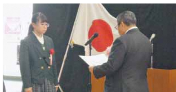
表彰を受ける西村さん 会場からは大きな拍手があがっていました