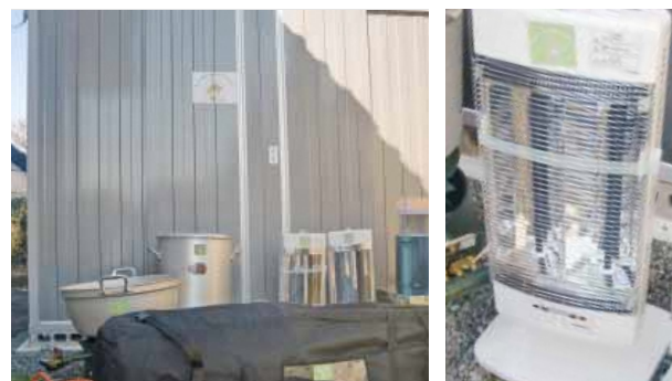
これらの備品は全て地域防災のために活用される予定です

今回、宝くじの助成金で整備した備品は灰塚区自主防災会で大切に管理され、災害発生時や地元防災訓練のときに活用されます。