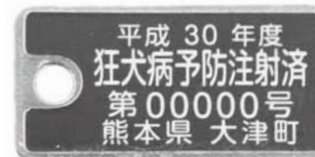
大津町の注射済票

最近、犬の逃走事例が増えています。首輪が緩んでいないか、リードがしっかりとつながつているかなど逃走防止のため、確認をお願いします。また、犬の屋外への放し飼いは条例(大津町犬による危害防止条例)によって禁止されています。必ず鎖や太い綱などで飼い犬をつないでください。