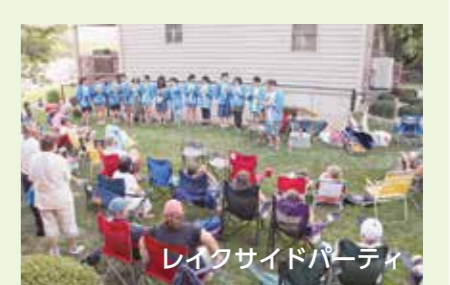
レイクサイドパーティー