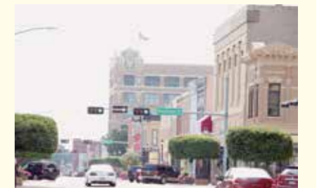
ヘイスティングズ市の町並み