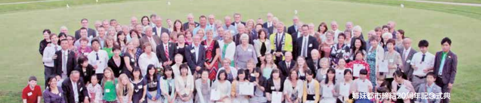
姉妹都市締結20周年記念式典