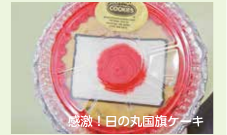
感激!日の丸国旗ケーキ