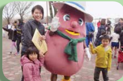
スポーツの森・大津ジョギングフェスティバルではからいもくんが大活躍