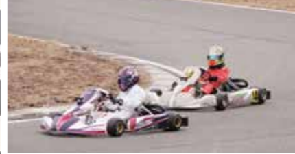
3月19日に行われた開幕戦では見事3位を獲得(左写真⑥)ジュニアクラスに入り初のシリーズだが手ごたえを感じられるものだった。