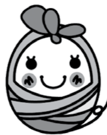
ここんイメージキャラクター ここんちゃん

熊本県子ども・若者総合相談センター「COCCON」ここんは、ニート、ひきこもり、不登校など熊本県の子ども・若者を対象とした総合相談窓口です。相談はもちろんのこと、必要に応じて更に適切な支援を提供できる機関と連携し、利用する人がよりよい支援を得られるよう心がけております。一人で抱え込まずに、まずは、相談してください。 ●問い合わせ 熊本県子ども・若者総合相談センター「COCCON」ここん ☎096(387)7000 住所 熊本市東区月出3丁目1-120 熊本県精神保健福祉センター2階 メール kowska-coccon@wind.ocn.ne.jp 電話受付時間 月～金 午前8時30分～午後9時 来所相談時間 月～金 午前8時30分～午後5時15分(要予約)