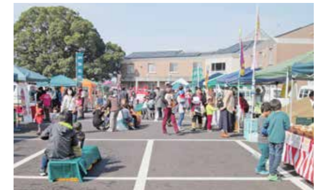
19店舗が参加し、約500人の来場者がありました

これは、肥後おおづ観光協会が隔月で行っているイベントで町で栽培された野菜や、養豚家で作る軽食、工芸品の販売などが行われています。「お買い物スタンプラリー」で旬のフルーツがあたる試みもあり、来場者は買い物を楽しんでいました。