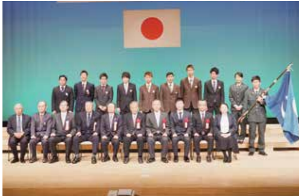
激励会では新入隊者の凛々しい顔が見られました

毎年恒例の菊池地区(菊池市・合志市・菊陽町・大津町)合同激励会が、3月12日に菊池市泗水ホールで開催され、自衛隊に入隊する皆さんを盛大に激励しました。