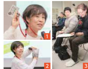
①大津町で開催された防災講演会。パーソナルカードのメリットを説明 ②③新聞紙で即席スリッパ作りを実践。母親目線による防災の取り組みに共感する人は男女問わず多い

和らげるための好物など、避難所にならざるを蓄える工夫も必要です。次に起こる災害では熊本地震のときのようにSNSで物資を求めたり、遠出をすれば物が買えたりできるとは限りません。買い物用ビニール袋とキッチンペーパーで作るオムツ、新聞紙で作るスリッパ、ツナ缶とティッシュペーパーで作るランプ、粉ミルク代わりの砂糖水など、今あるものを工夫して使うなど知恵を絞ることが家族を守ることに繋がります。親の不安は子どもに伝わるので、いざというときに慌てないよう備えておきたいですね。