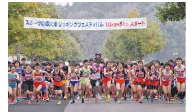
大迫力のスタート

「第18回スポーツの森・大津ジョギングフェスティバル」が2月26日に町運動公園で開催されました。当日は1歳から83歳の約1,000人とホンダ熊本硬式野球部の選手が参加。それぞれ2km、5km、10kmのコースを自分のペースで走り、爽やかな汗を流していました。さらに、今大会は吉本興業(株)所属の芸人らがゲストランナーとして参加し大会を盛り上げていました。