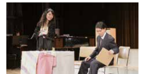
大津少年少女合唱団 第21回定期演奏会