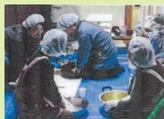
毎年恒例のそば打ちなど災害時でも顔の見える関係づくりを続けている