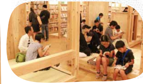
多くの人でにぎわう館内