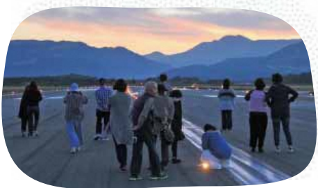
ランウェイウォークのようす

阿蘇くまもと空港は、夕日を背景にした飛行機を撮るために多くのカメラマンが集まるスポットです。間近で発着を見るなら障害物がない滑走路北側がおススメ。家族や恋人と一緒に、夕空に浮かぶ飛行機を見に行つてはいかがですか。毎年フォトコンテストも行われています。 10月中旬には「空の日フェスタ」を開催。滑走路を歩きながら夜明けを迎えるランウェイウォークや、普段立ち入ることができない空港制限区域内バスツアーなどが行われます。 現在、創造的復興のシンボルとなる新ビル建設が進められており、構内の混雑が予想されます。お越しの際はできるだけ公共交通機関をご利用ください。