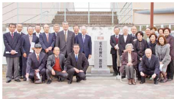
荒木氏の顕彰碑を囲む式典参加者の皆さん 同氏は「大津町＝サッカー」を世間に広めたことも偉業の一つです

同氏は、町政の柱として12年間、町の発展と住民福祉の向上に努めました。教育の面では毎月14日を「大津町教育の日」に定め、地域に開かれた学校作りに尽力するなど、数々の町に対する偉業を成し遂げています。