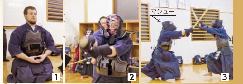
1礼から始まる練習。剣道は心も鍛えます。2面打ちの練習。緊張で肩に力が入りすぎました。3最後は先生と一騎打ち。声では負けられないように必死に挑みます。

「大津少年剣道クラブ」、「大津南少年剣道クラブ」、「龍成館」の3団体で構成され、幼稚園・保育園から小学6年生まで約70人が加入し、日々厳しい鍛練を積んでいます。