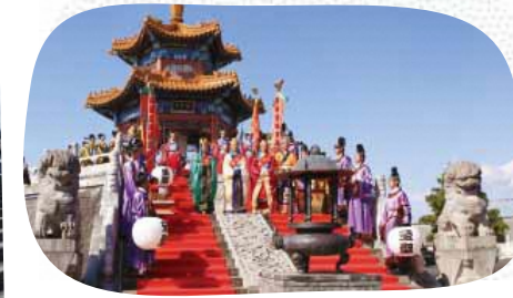
華やかな衣装で舞う祭孔大典