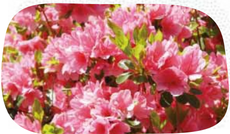
園内に咲き誇るツツジ

ツツジの名所。世界中から集められた15種類、約4万本のツツジが咲き誇ります。4月中旬から5月初旬は、クルマツツジやキリシマツツジ、5月初旬から中旬はヒラドツツジやシャクナゲが見頃を迎え、シーズン中は訪れる度に違う種類のツツジを楽しめます。桜も多く、4月初旬からお花見客で賑わいます。園内には芝生広場や、ブランコ、アスレチック遊具などがあり、子どものお出かけにもぴったりです。園内を歩きながら、桜や色とりどりのツツジを眺め、春を感じてみませんか。