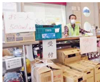
避難所では情報を見えるように書いて設置 避難者が安心できるよう工夫していました

夜間に発生した熊本地震では、多くの人は家族が家にいる状況だったと思います。災害はいつ起こるか分かりません。日中家族が離れた状況で災害が起こったら、どのように連絡するのか、どこに集まるのか。大切な人と生き延びるために、経験を生かして想像することで、今できることが見えてくるはず。町では、全世帯にハザードマップを配布しています。このマップは危険箇所や避難場所、非常用持出品のリストなども掲載しています。これを使い、災害から身を守る方法を家族で確認しましょう。難しいことはありません。家族でマップを広げるだけで対話の時間ができます。