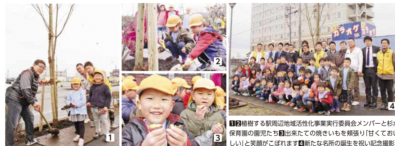
1,2 植樹する駅周辺地域活性化事業実行委員会メンバーと杉水保育園の園児たち 3 出来たての焼きいもを頬張り「甘くておいしい」と笑顔がこぼれます 4 新たな名所の誕生を祝い記念撮影

声をかけながら桜の根に土を被せていました。桜の植樹に続いてつつじの苗植えも行われ、作業後には焼きいもの振る舞いもあり、笑顔が溢れる地域交流の催しになりました。参加した杉水保育園の園児は、「花が咲くのが楽しみ、近くに来たときに見にきたいです」と笑顔で話してくれました。桜の散歩道はイオン大津店西側に16本植樹され、平成31年度は東側に植樹を行う予定です。