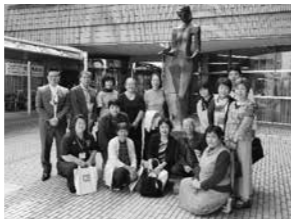
審議会では男女共同参画推進のため先進地研修なども行います。写真は昨年熊本市で行った合同視察研修の様子。

町では、男女がお互いに人権を尊重しながら、性別に関係なく個性と能力を十分に発揮できる社会の実現を目指し、男女共同参画を推進しています。 このたび、新たに男女共同参画推進委員を募集します。委員の仕事は、年に6回程度の会議・研修会に出席して、男女共同参画の推進に関する啓発活動と調査研究をすることです。 あなたも、この機会に日常の中にある課題に目を向けてみませんか。 ●応募資格 町内に住民票がある人または在勤の20歳以上の人 ●募集人員 4人(募集人員を超えた場合は選考します) ●任期 2年(4月～平成33年3月末) ※町規定の報酬・費用弁償を支払います。 ●応募方法 住所、氏名、年齢、電話番号、応募理由を提出してください。(様式は自由) ●応募期限 4月19日(金)※必着 ●郵送先 〒869-1236 大津町大字杉水932番地3 大津町人権啓発福祉センター内 人権推進課 男女共同参画推進係