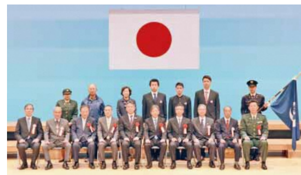
激励会では新入隊者の皆さんが保護者への感謝の言葉と抱負を述べ、記念品が贈られました

毎年恒例の菊池地区(菊池市・合志市・菊陽町・大津町)合同激励会が、3月10日に合志市総合センターヴィーブルで開催され、自衛隊に入隊する皆さんを盛大に激励しました。