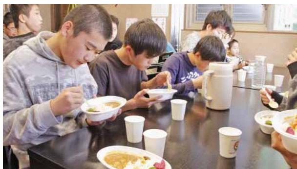
子どもたちは、振舞われたカレーを笑顔で頬張っていました

これは、熊本大津ライオンズクラブが普段経験することが少ない外食の楽しみを施設の子どもたちにも味わってほしいという思いから行っているものです。平成28年熊本地震時には中断していましたが、今回5回目の取り組みとして行われました。