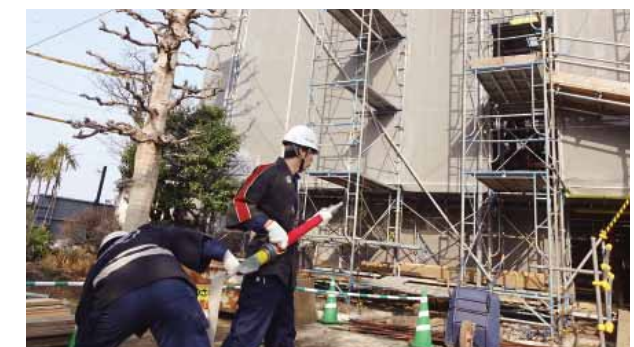
火災を想定した建物にホースを構える地元消防団員

当日は工事中の広間から出火した想定訓練で、自衛消防隊や地区の消防団らが参加。消防署とも連携し、参加者は熱心に有事のための手順を確認していました。