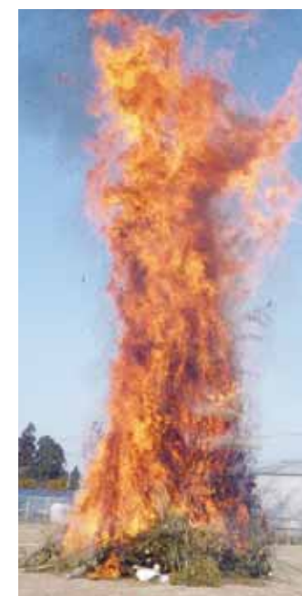
火をつけ始めと共にパチパチと大きな音をたて瞬く間に大きな炎に

グラウンドには新年のあいさつがところどころ聞こえ、地区の住民約100人が集まりました。地域組織活動クラブからは出来立てのぜんざいが振る舞われ、参加者は冷える体を温めていました。