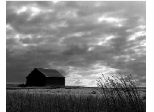
ネブラスカ州リンカーンの草原と空