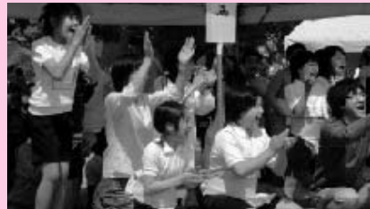
つつい応援に力が入ります