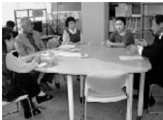
商店街への思いを意見交換

このようなことから、地域の現状や町の事業について、住民の方々の意見をじっくり聞き、今年策定予定の「大津町振興総合計画」に反映させていきたいと考えています。