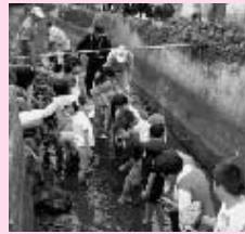
大活躍の子どもたち

○荒れた「里山」もスッキリ! 窯の近くには「里山」がありますが、最近はその手が入らず、また、度重なる台風などで荒れていました。 炭焼きの原料となる木材や竹を里山から調達することで、里山の手入れもできました。