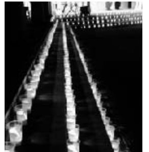
ろうそくの明かりで幻想的な雰囲気を出

20年ぶりに登場したみこし行列(むつみ会)では、みこしを担いだ若者の「セツヤ!セツヤ!」と威勢の良い掛け声と笛が鳴り響き、祭は最高潮に達しました。