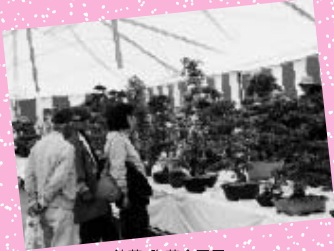
銘花・陶芸合同展