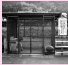
9カ所のゴミステーションはいつもピカピカ!

今年度は、町の将来計画である「大津町振興総合計画」の策定年度となっています。 この計画に、住民のみならずの意見を反映させるため、職員が地域づくりアドバイザーとして各地域に出向き、町の主要な政策についての説明や意見交換を行う予定です。 また、環境活動で要望の多かった刈払い機やチェーンソーの備品購入も事業の対象となりました。