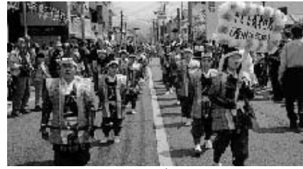
つつじ祭といえばやっぱり子ども「武者行列」