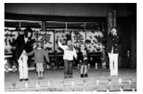
ファミリーコンサートの様子

4月16日・17日の両日、昭和園や中心商店街、オークス広場を会場に、「大津つつじ祭」が開催されました。