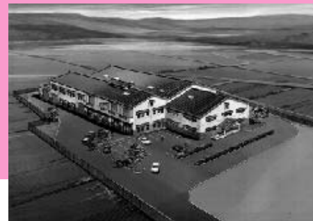
菊池広域連合「汚泥再生処理センター(仮称)」完成予想図

菊池広域連合(菊池市・大津町・菊陽町・合志町・西合志町)では、現在、菊池市木柑子地内に建設中の汚泥再生処理センター(仮称)の名称を募集します。地域に親しまれる施設となるよう、皆さんの応募をお待ちしています。