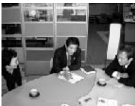
福祉と教育について意見交換

■宅老幼所「ゆう・あい(1名) 2年前に帰郷し、「肥後いこいの家グループホーム灰塚」