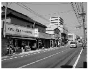
中央バス停を中心とした前菜会

少子高齢化社会を迎え、労働人口や年金などの問題が議論されています。このような背景から、国の福祉政策についてもさまざまな角度から検討がなされています。町では、さまざまな福祉事業を行っており、特に子育て支援事業については、全国から注目が集まっています。 福祉政策は、その時代の