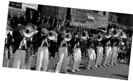
大津中学校吹奏楽部のマーチング