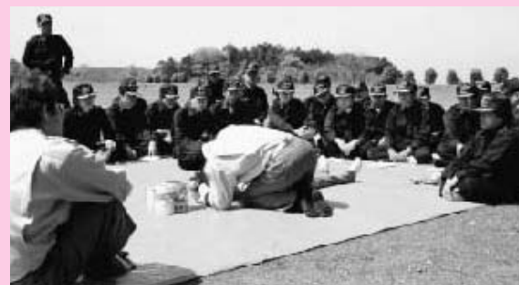
心肺蘇生法の実技指導の様子