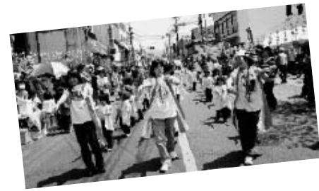
たくさん子どもたちが参加しパレードを楽しんでいました