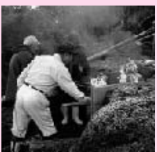
すばらしい炭ができますように

○手作り窯の完成と火入れ式 1月8日、約1週間かけて完成した窯に事業の成功を祈念して火入れ式が行われました。