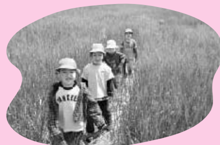
4月26日、白川保育園の子どもたちが挑戦

迷路に挑戦した子どもたちは「おもしろかった」「何回もやってみよう」と、思う存分麦畑を駆けまわり、楽しんでいました。