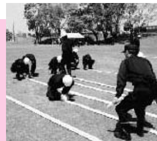
消防ホースの巻き方の訓練を受ける新入団員