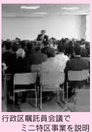
行政区福祉員会議でミ二特区事業を説明

今年度は、町の将来計画である「大津町振興総合計画」の策定年度となっています。 この計画に、住民のみならずの意見を反映させるため、職員が地域づくりアドバイザーとして各地域に出向き、町の主要な政策についての説明や意見交換を行う予定です。 また、環境活動で要望の多かった刈払い機やチェーンソーの備品購入も事業の対象となりました。