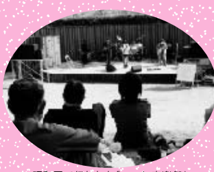
昭和園で行われた「つつじ音楽祭」