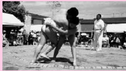
土俵際の熱戦が繰り広げられた子ども相撲大会