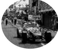
クラシックカーもパレードに参加