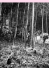
傘をさして人が通れる幅が竹林間伐の目安です

○「炭」が取り持つ交流へ発展 5月8日、地元と熊本市の親子約100人が炭を使った河川(農業用水路)浄化に取り組みました。