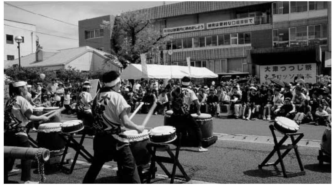
役場前のステージは、たくさんの人でにぎわいました