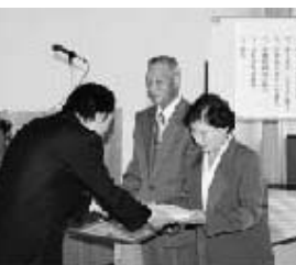
昨年行われた金婚夫婦表彰式の様子