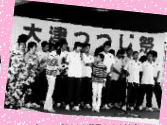
「ロッソ熊本」の選手との交流会