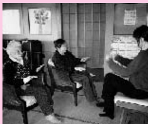
宅老幼所(ゆう・あい)「手足の運動の様子」