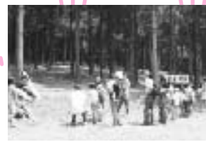
やっぱり最後の難関「輪投げ」、行列ができてしまいました