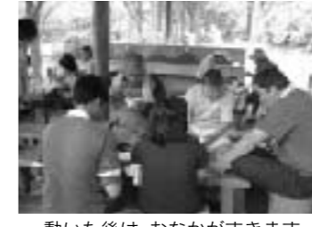
動いた後は、おなががすきます