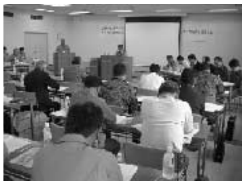
地域防災会議の様相

6月8日、「町地域防災会議」と「水防協議会」が生涯学習センターで開催されました。会議には、関係者約50人が出席。町内で災害が発生した場合の対策や関係機関との連携、災害救助法の適用などについて話し合わせ、町地域防災計画案と町水防計画案が承認されました。