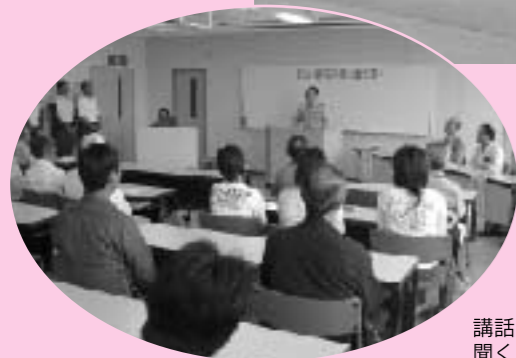
講話を真剣に聞く皆さん