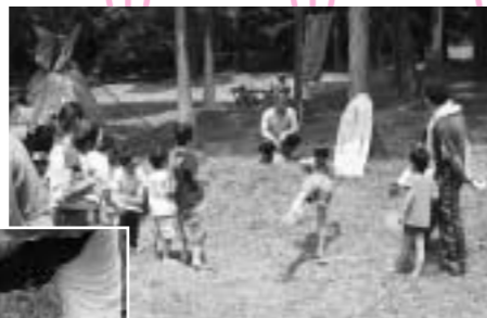
「輪投げ」簡単そうに見えて、実はやっぱり難しい?