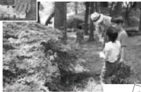
「カモフラージュ」木や草に隠れてな～