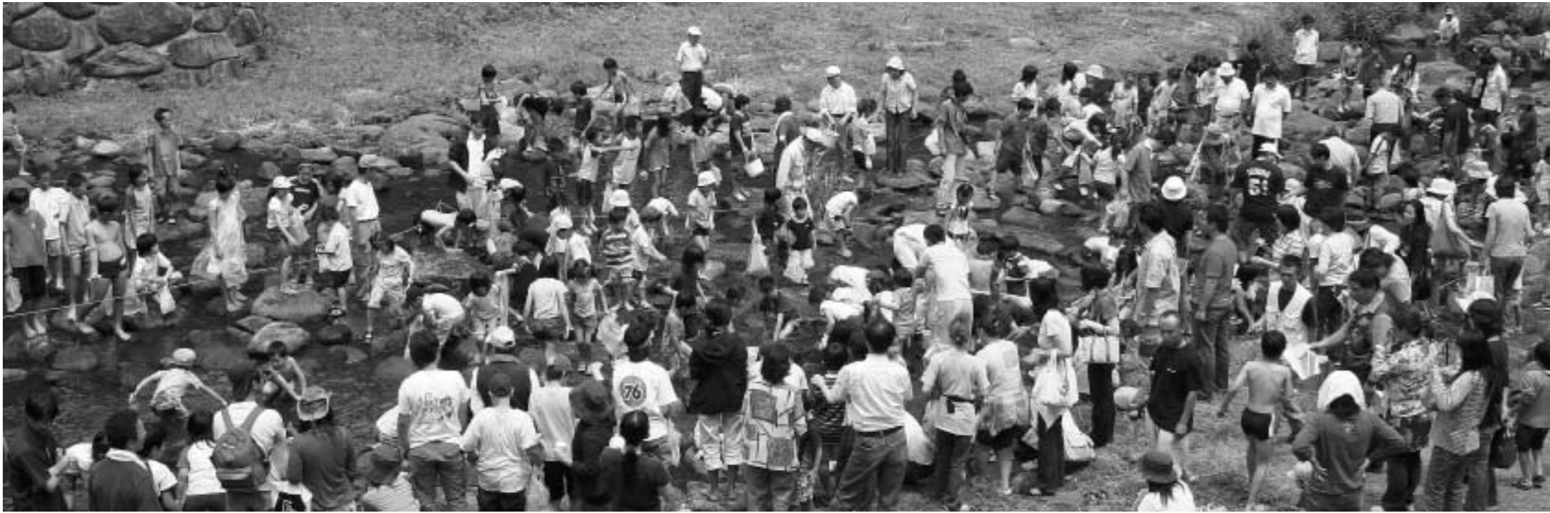
「ヤマメのつかみ取り」には、こんなにたくさんのひとが!!

6月4日、陽の原キャンプ場で「弥護山自然公園山開き」が行われました。 町内外の親子連れや緑の少年団などの皆さんが、ヤマメのつかみ取りや見体験ラリー、木工教室、陶芸体験などを楽しみました。