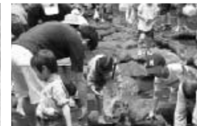
みんなヤマメ探しに真剣です