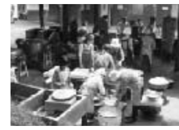
おにぎり、だご汁をつくってもらいました