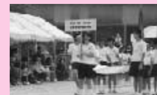
大津中学校の体育大会