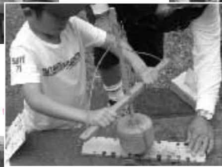
「火おこし」昔の人は大変だったんだよ