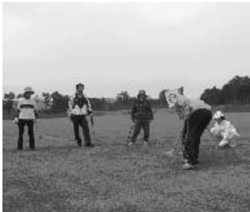
スポーツで親交を深めます

5月28日、町運動公園多目的広場で、引水東区グラウンドゴルフ大会を開催しました。引水東区は新興住宅が多く、まず「お互いが顔見知りにな