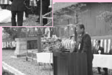
家入町長による祝辞