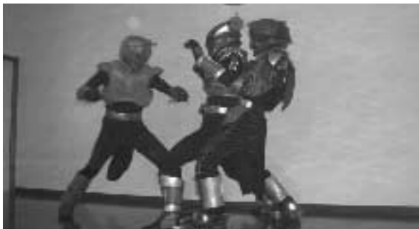
おなじみグランパワーヒーロー!

5月27日、上中・御願所コミュニティセンターで、ホタル祭りが開催されました。川の護岸を自分たちで整備しながらホタル鑑賞を楽しむにしています。当日はあいの雨で見ることが出来ませんでした。ステージでは、今やあちこちのイベントにひっぱりだこの地元ヒーロー「グランパワーヒーロー」の登場に、子どもたちは大喜び。祭りは最高の盛り上がりを見せました。