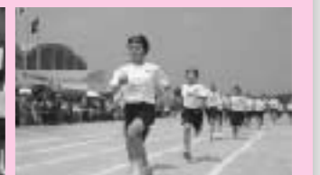
大津北中学校の体育大会