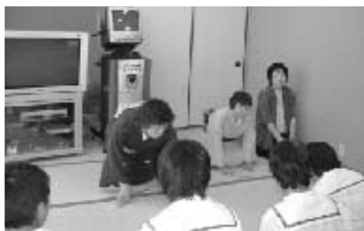
お茶も楽しみながらやりましょう

昨年、保育園でお茶席を開いたときに、園児が立てたお茶に保護者の人が「ありがとうございます」とお礼を言いました。子どもの人権を認めたらこそ自然に出た言葉だ