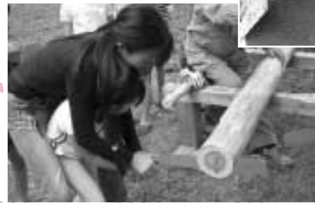
「丸太切り」2人の力でヨイショヨイショ