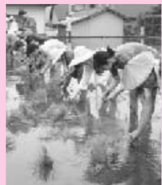
徐々に田植えのコツをつかんできました