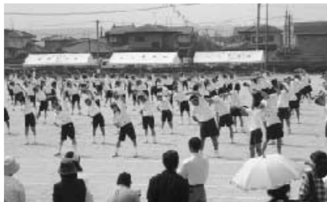
大津中学校体育大会のラジオ体操