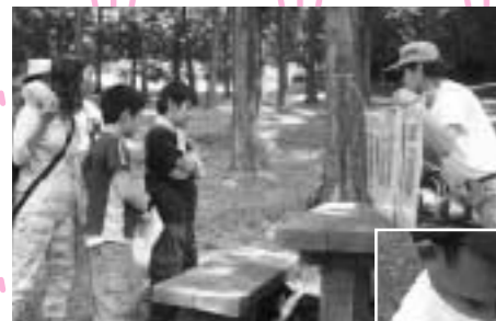
「鳥の鳴き声」この鳴き声わかるかな～?