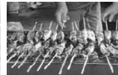
おいしそうでしょう?