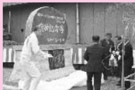
記念碑の幕が下ろされた瞬間

式典では、記念碑が除幕された後、家入町長、宇野議長、菊池台地土地改良課長が祝辞を述べました。