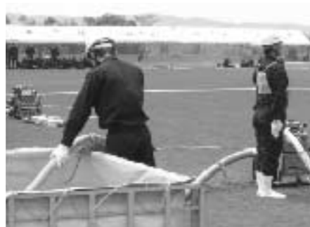
ポンプで水槽から水を吸い上げます

5月14日、町運動公園で大津町消防団操法大会が開催されました。大会では、各分団の代表選手たちが、日頃の訓練の成果を十分に発揮し、小型ポンプの操作と動作の規律を競い合っていました。優勝は、第3分団第2班。準優勝は、本部。第3位は、第6分団御所原班でした。上位3チームと、消防団幹