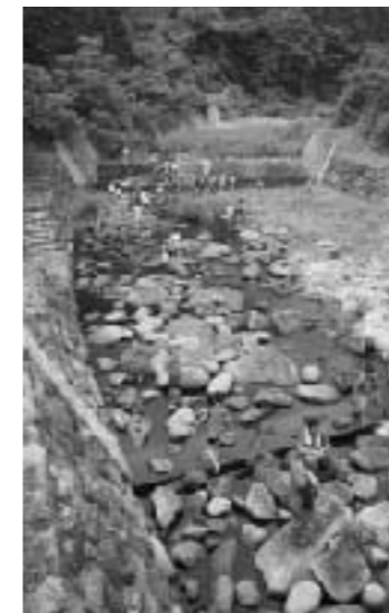
きれいな水が流れていました