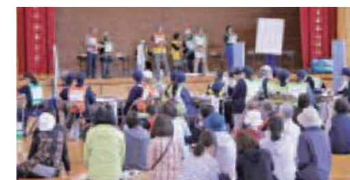
東小における避難所開設・運営訓練運営班ごとに訓練内容の報告を行いました