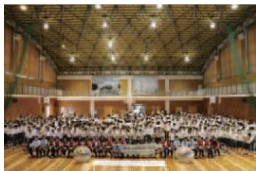
歓迎レセプションの様子

2日間の交流の中で、民族中の生徒たちは、書道や理科の授業に参加したり、地域の人と一緒に郷土料理を作ったりして交流を深めました。夜は大津北中の生徒の家にホームステイをし、日本での生活を楽しみました。