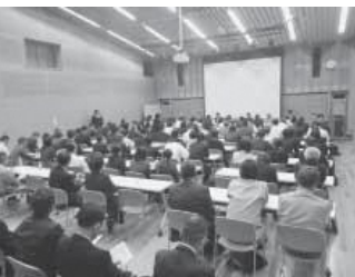
第2分散会での報告会の様子

さまざまな人権課題がありますが、「正しく知り実践すること」そして、「自分」として捉えて人権感覚を磨くこと」を大切に、一人一人の人権と多様性を尊重する会社として、明るい地域社会づくりに貢献できるように、今後も精進していきます。