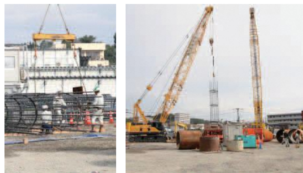
鉄筋のカゴを吊り上げてケーシング内に入れている様子 詳細は町ホームページをご覧ください

杭工事が11月6日から始まりしました。新庁舎の杭(場所打ちコンクリート杭)は、地下約20mにある固い地層まで直径約2mの穴を掘削し、その中に鉄筋のカゴを入れコンクリートを流し込むことにより、柱を作ります。この工事は12月下旬まで続き、42本の場所打ちコンクリート杭を作ります。杭工事後は、地下工事の安全対策となる仮設工事の山留め工事を開始します。