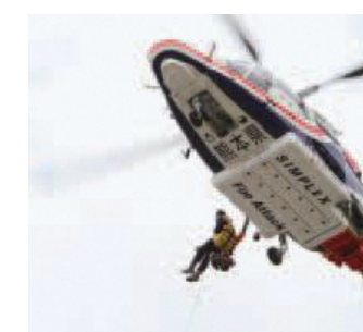
菊池広域連合南消防署員による熊本県防災消防ヘリ「ひばり」での救出訓練