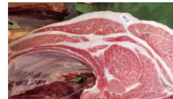
受賞した(株)帆保畜産出品の枝肉

(株)熊本県畜産流通センター(菊池市)において10月14日～18日までの5日間、第27回熊本県肉畜共進会が開催されました。黒毛和種24頭、あか毛和種22頭の中から(株)帆保畜産(下町)がグランドチャンピオンと農林水産大臣賞を受賞しました。日々丹精込めて育てた牛が県内トップクラスと評価され、県内外に向けて高い技術力が発信されました。