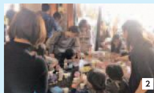
1 多くの人で賑わう会場の交流センター 2 建物内にもワークショップなどが出店しました