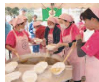
食改による炊き出し訓練ではアルファ米のカレーが作られました

大津町総合防災訓練が10月27日に行われ、避難所運営訓練や炊き出しなどの訓練を実施しました。午前9時に震度6強を想定した防災無線が放送され、町内の自治会ごとに防災訓練が開始されました。その後、災害対策本部から避難指示が出され、大津東小学校に指定避難所を設置しました。周辺地域の行政区嘱託員の皆さんを中心に避難所運営の組織を作り、それぞれの班に分かれ、地域と行政が一体となった訓練が行われました。今回は防災消防ヘリの飛行展示も行われ、参加者は普段見られない救出の様子を熱心に眺めていました。