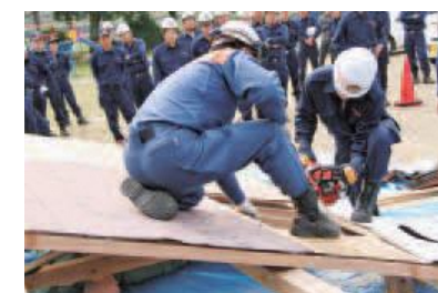
消防士の指導のもと消防団員による倒壊家屋からの救助訓練が行われました