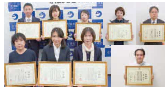
表彰された皆さん これからもご活躍ください