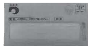
県との共同催告状