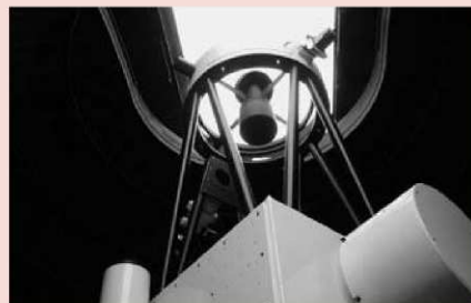
九州最大級82センチ反射望遠鏡