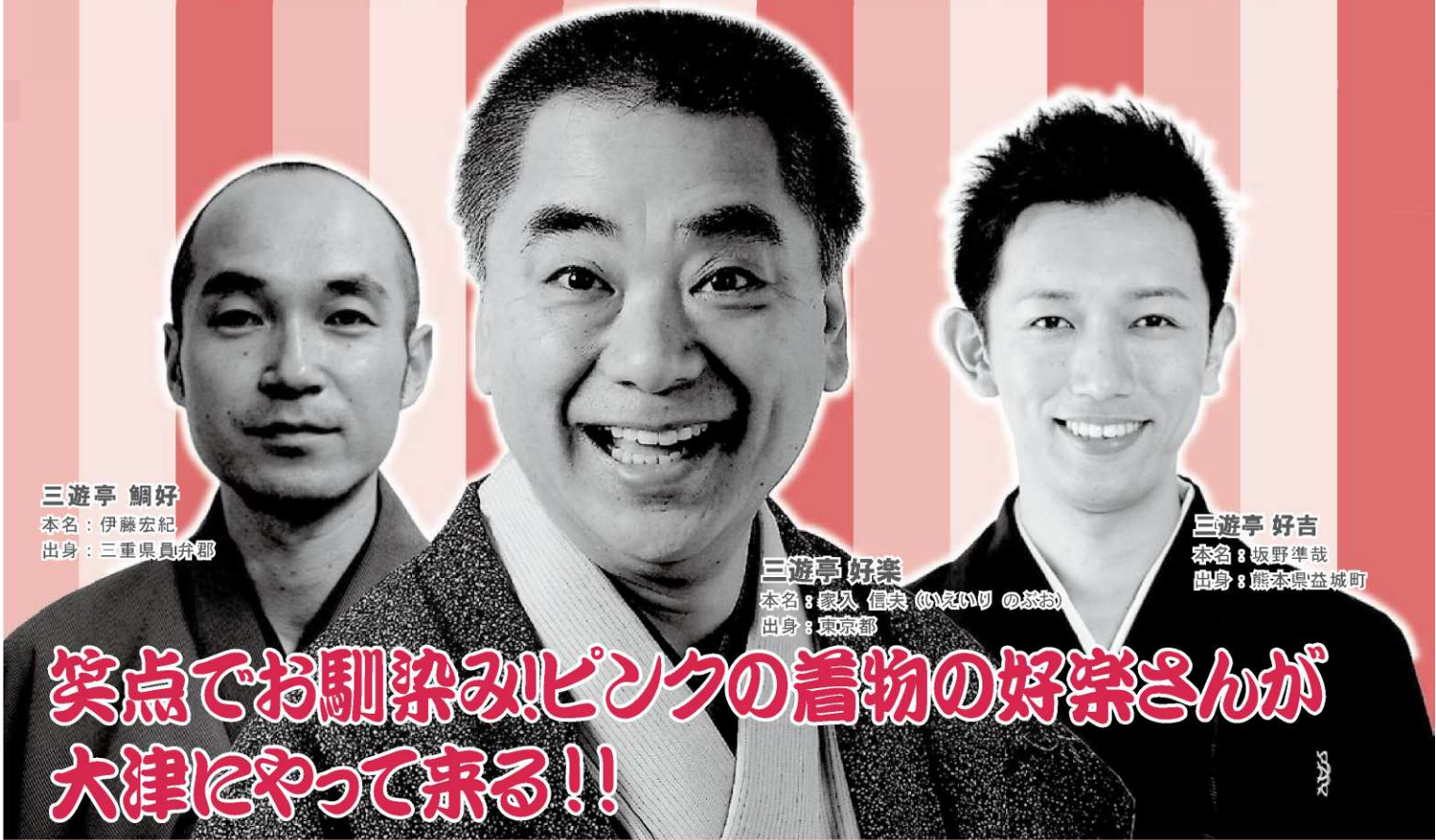
三遊亭 鯛好 本名：伊藤宏紀 出身：三重県員弁郡