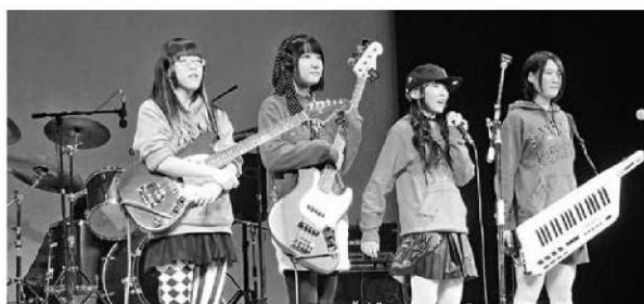
(メンバー全員中学3年生のガールズバンド パニック☆ラビッツ)

11月30日(日)、町文化ホールにおいて第3回大津・菊陽音楽協会定期演奏会が開催され、大津町・菊陽町に在住、在勤するアマチュアの音楽愛好者による8グループが出演しました。フォーク、ロックなどの演奏に会場から盛んな拍手が送られていました。