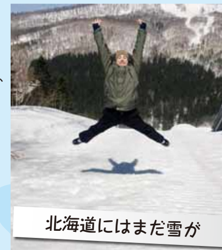
北海道にはまだ雪が

ひょっとすると、今月皆さんは姉妹都市ヘイスティングズ市からの訪問団グループを見かけるかもしれません。もし見かけたら、その時は日本のおもてなしを見せて歓迎してください！その11人は全員日本が初めてで、初めてのことを経験しているのです。だからこそ、あなたの番です！