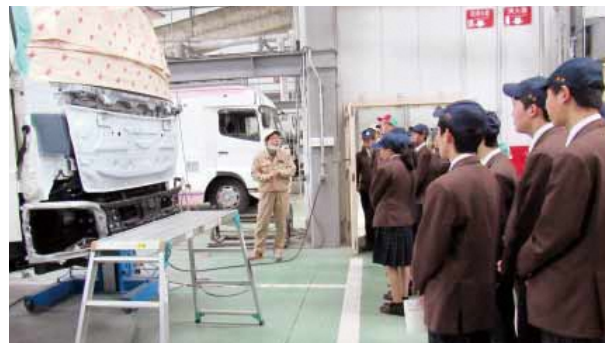
伊豆ミズ車体製作所の工場見学を行う生徒たち

見学会では、企業概要の学習や、若手従業員との意見交換が行われました。参加した生徒からは、「職場の雰囲気を感じることができ、今後の進路選択の参考になりました」と希望に溢れる感想が出ていました。