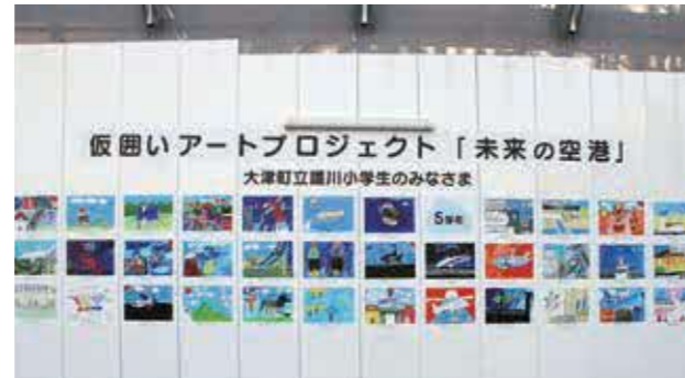
国際線旅客ターミナルビル入口付近の壁に作品を展示中

町からは、護川小学校の3年生から6年生の児童の117点の作品を令和4年2月末まで展示しています。工事状況により、展示期間は変更する場合があります。