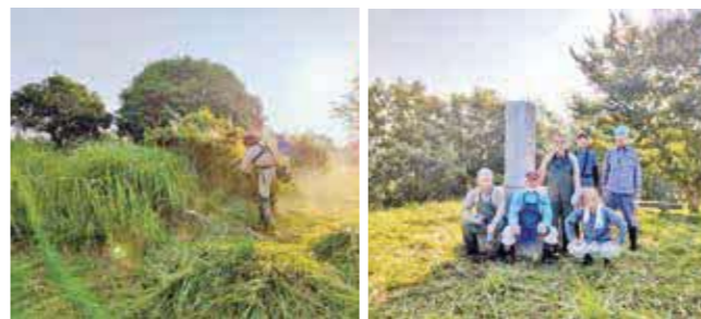
保護委員の皆さんは、年に一度「広葉樹2000年の森」の草刈り活動を行っています。