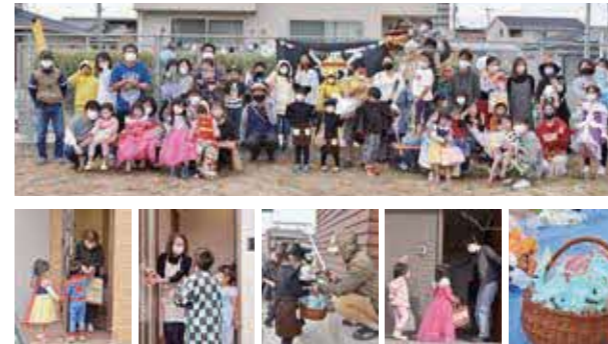
消毒などの感染症対策を講じた上で、参加した子どもたちはお菓子をもらってとても喜んでいました

新区で10月24日、「ハッピーハロウィンプロジェクト」を行いました。これは、子どもたちが組内の15の家庭を訪問して、お菓子をもらうイベントです。当日は、子どもたちが元気良く家を訪問しました。全ての家を回り終えた後に、子どもたちがもらったお菓子をみんなで分け合いました。参加者の中には、仮装を楽しむ家族もいて、「お菓子をいっぱいもらえて楽しかった」「またみんなでハロウィンをやりたい」と、大盛り上がりでした。