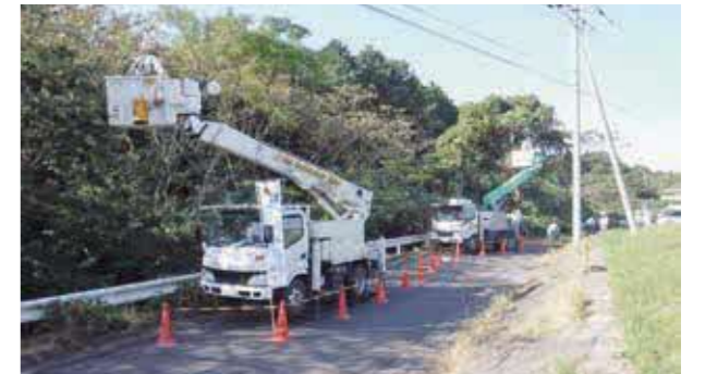
道路にはみ出た樹木の伐採を行っています

伐採により道路が安全に利用できるようになりました。ボランティア活動ありがとうございました。