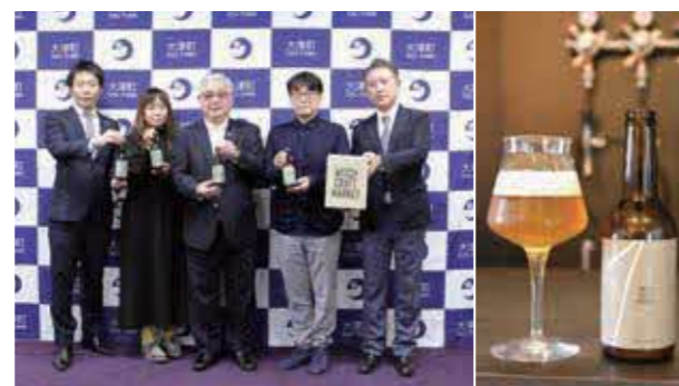
町に完成の報告をしました