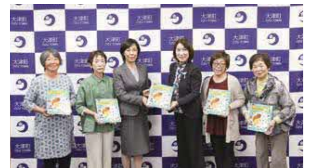
更生保護女性会の皆さんから絵本の贈呈

町更生保護女性会は、青少年の健全な育成に努めるとともに、関係団体と連携しつつ、過ちに陥った人たちの更生のための支えとなることを目的に、小中学校での読み聞かせ活動、幼稚園・保育園での郷土料理教室、更生の支援などを行っています。新型コロナウイルス感染症の影響を受け、学校への往訪ができなかったこともあり、絵本を贈る取り組みを計画されました。