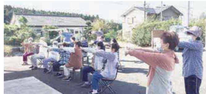
▲感染防止対策を行い、10月から新小屋地区で「通いの場」が再開しました。