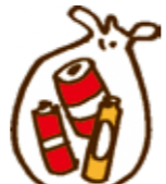
乾電池・ボタン電池