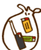
ライター・点火棒