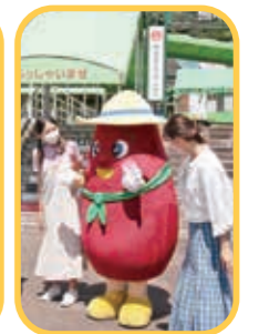
道の駅大津にからいもくん登場