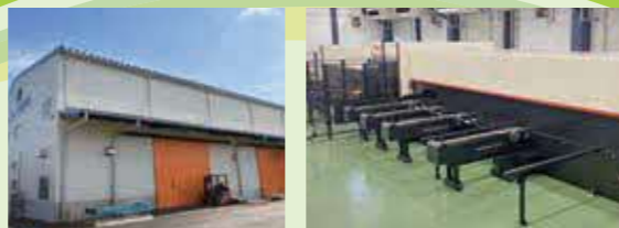
令和4年8月に操業開始した板金製缶の新工場