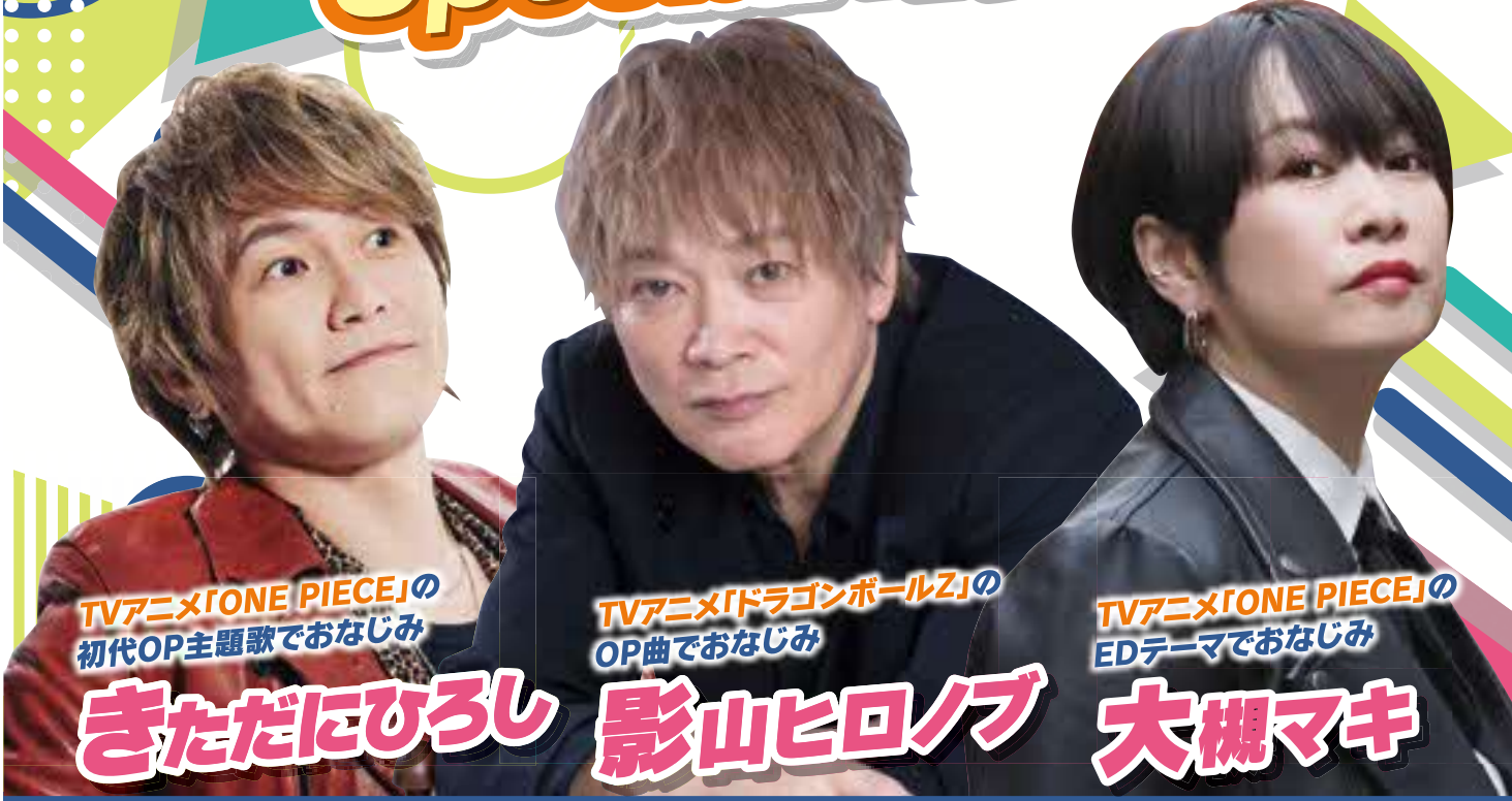
TVアニメ「ONE PIECE」の 初代OP主題歌でおなじみ