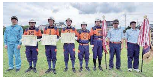
小型ポンプの部優勝の第3分団