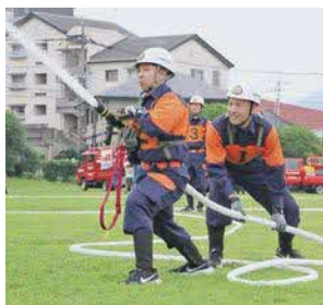
現場で役立つ技術を磨く「実践消防操法」。型に縛られず、チーム独自の戦術で的を狙う、リアルな訓練です。

各分団の訓練では、団員同士で積極的に意見を出し合い、試行錯誤を繰り返す姿が多く見られました。これにより、実際の災害現場に直結する生きたスキルが磨かれ、消防団全体の対応力向上に繋がる大会となりました。