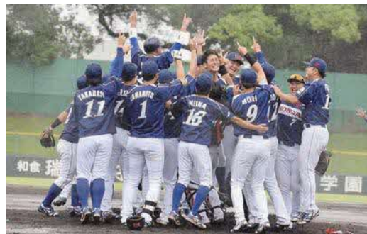
本大会出場を決め、喜ぶ選手たち