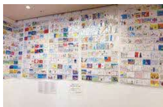
▲過去のはがきアート展示の様子