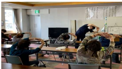
『はつらつ元気づくり事業』の風景

介護保険要支援認定者や基本チェックリストにより事業対象者とされた方へ、日常動作訓練の場や生活支援の援助を行い、高齢者の日常生活の自立を目指した支援を行います。