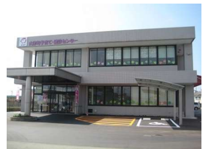
子育て・健診センター

子育て・健診センターの施設管理のための経費です。主なものは、点検・管理の委託料や光熱水費です。空港アクセス鉄道計画に伴い、大津中央公園の再整備が必要となるため、老朽化した施設の建替えや複合化を含めた施設配置の検討を進めます。