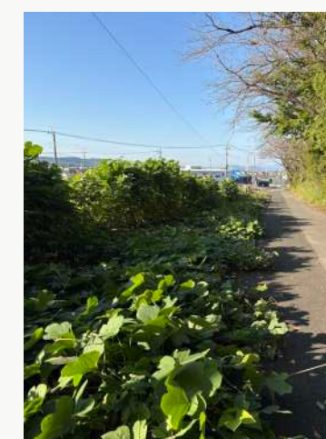
南側町道の草刈り