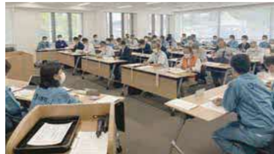
会議には関係者の約50人が参加