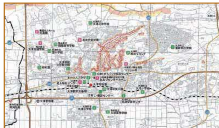
洪水・土砂災害ハザードマップ ※イメージ

令和5年3月に矢護川・平川・日向川のハザードマップを更新しました。また、7月梅雨明け時の集中豪雨や8月から9月にかけての台風接近時には浸水や土砂災害の発生などが心配されます。事前にハザードマップを活用して自宅周りの危険箇所や避難所、避難経路を確認し、水害などの災害に備えましょう。 ※ハザードマップは役場防災交通課に準備しています。また、町ホームページでも確認できます。