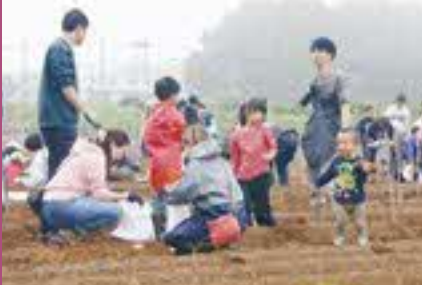
▲からいもフェスティバルの「からいも掘り大会」は毎年行列ができるほどの名物イベント。さらにおいしいからいもを目指して、今年は土にもこだわった。