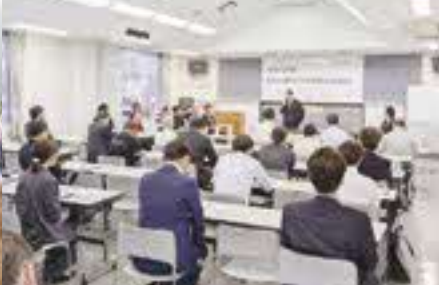
▲町民と役場職員が集まり、今年の活動や祭りの準備を話し合う明日観の会議。