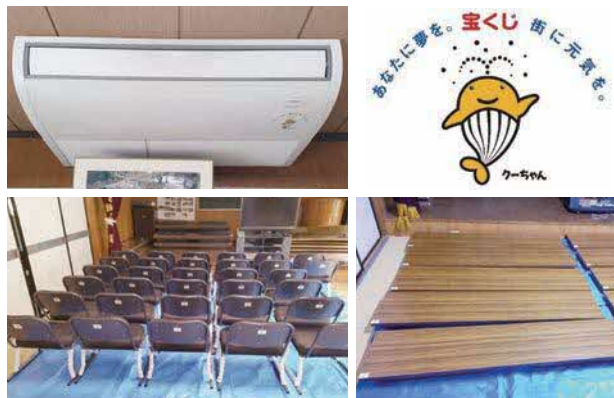
外牧区公民館に整備したエアコン、椅子、テーブル

この程、コミュニティの健全な発展を図ることを目的としたコミュニティ助成事業を活用して、外牧区にエアコン、椅子、テーブルなどを整備しました。このコミュニティ助成事業は、宝くじ社会貢献広報事業費を財源として、コミュニティ活動に必要な備品や集会施設の整備などに一般財団法人自治総合センターが助成を行うものです。今後、外牧区のますますの活性化が期待されます。