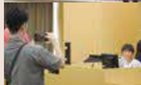
▲議会イベントで議長の席を体験

地域の福祉団体が役場周辺に集まり、ステージイベントのほかハロウィンゴミ拾いパレードや青楓館高等学院（兵庫県）が実施するインクルーシブなまちづくりイベント、大津町の議場の雰囲気味わえる議会イベントも同時開催しました。