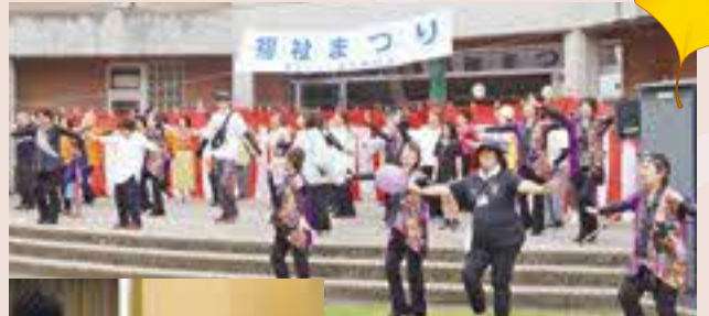
▲参加者もステージに上がってイベントを楽しみました