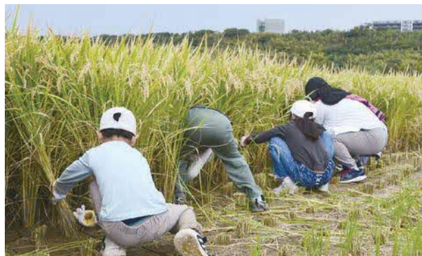
参加者は手作業の大変さと、収穫の喜びを体で感じました

白川中流域土地改良区協議会による「田んぼの学校 in 白川中流域2025」が10月18日に菊陽町で開催されました。農業と地下水かん養のつながりを学ぶことを目的に毎年行われており、町内外から集まった小学生と保護者が参加し、6月に田植えをした田んぼで稲刈りを体験しました。足踏み脱穀機や千歯こき、唐箕など昔の道具にも挑戦し、収穫した新米のおにぎりを笑顔で味わいました。今回はカントリーエレベーターの見学も行いました。