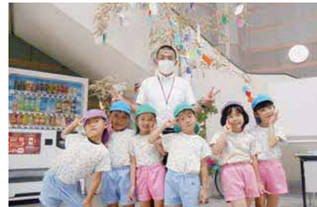
大津音楽幼稚園の園児たち

大津音楽幼稚園の園児が6月23日にオクスプラザを訪れ、七夕飾りを寄贈しました。七夕飾りには、色とりどりの折り紙で作られた装飾とともに、「かがくしゃになりたい」「ようちえんの先生になりたい」「りれーで1ばんになりたい」などいろんな願いごとが書かれた短冊が付けられています。夏の恒例行事である七夕飾りは、オクスプラザの他に、おおづ図書館と大津郵便局にも寄贈されています。