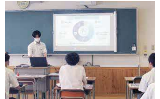
将来、社会人として働くイメージなどを膨らませる生徒たち

大津町企業連絡協議会(町内企業70社で構成)の主催で「大津町企業ガイダンス」が6月16日、翔陽高校で開催されました。民間企業へ就職を希望する3年次生122人とその保護者が参加。製造業や運送業、サービス業など20社の企業が参加し、今年で5回目の開催となります。各教室に企業ブースを設置し、企業の担当者が映像を使い、仕事風景や自社の商品を見せながら、業務内容や企業理念、地元企業で働く意味などを説明しました。