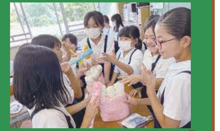
みんなで歯と歯茎の模型を使って歯磨きの練習をしました