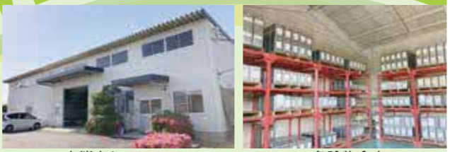
東熊本センター 事務所倉庫棟 (営業用倉庫登録済み)

弊社は昭和4年、九州では初の塗料専門販売店として創業して以来、一貫してお客様にご満足いただける商品とサービスを提供できる存在でありたいと努力してまいりました。