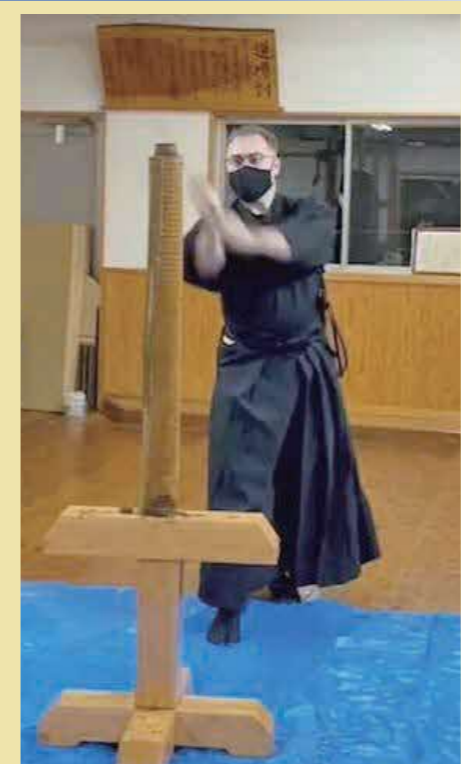
畳表などを刀で切ります

私が日本に来たとき、新型コロナウイルス感染症の影響を受け、東京で2週間待機し、大津町に来ました。コロナによる制限で、仕事以外で人に会ったり、新しい友だちを作ったりするのは難しかったです。そこで新しい人と出会うために始めたのが居合道でした。元々日本の文化や武道に興味があったので、居合道を体験したときはとても興奮しました。居合道は、集中力や自分自身を理解しようとするなど多くのことを教えてくれます。居合道を練習するうちに、座り方や食べ方、敬意を示すことなど、日本の礼儀作法を知りました。