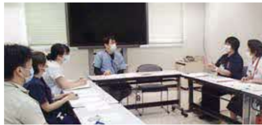
初期集中支援会議

A 老化によるもの忘れは体験の一部を忘れませんが、「認知症によるもの忘れ」は体験の全