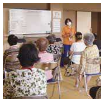
通いの場の活動風景

参加者からは「通いの場に参加しからは運動習慣がついた」「これからも継続して参加したい」などの感想がありました。