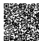
通いの場の開催場所はこちら▼