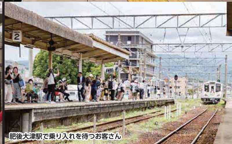
肥後大津駅で乗り入れを待つお客さん