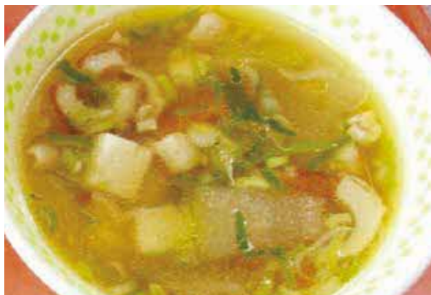
令和5年7月19日給食献立 大津町学校給食センター

「のっぺい汁」は全国さまざまな地域の郷土料理としてもおなじみの料理ですね。今回は冬瓜を使った「夏のっぺい汁」を紹介します。冬瓜は食べる機会が少ない食材の一つかもしれません。給食では、7~9月頃に冬瓜を取り入れた料理を取り入れています。ウリ科の野菜で、水分やカリウム、ビタミンCなどを多く含みます。体を冷やす作用もあっていわれているので、夏の暑い時期にはおすすめの食材です。加熱すると果肉は透き通り、皮のあたりは淡い緑色になります。旬の時期にぜひお試しください。