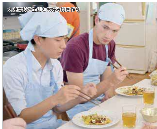
大津高校の生徒とお好み焼き作り