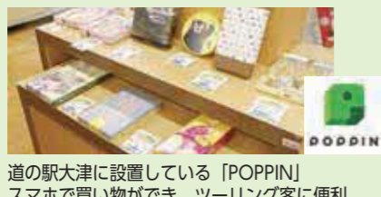
道の駅大津に設置している「POPPIN」スマホで買い物ができ、ツーリング客に便利