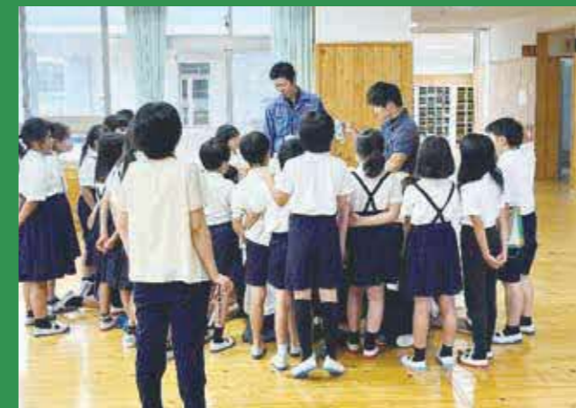
ごみの分別体験に児童たちは興味津々

また、カップラーメンの容器や貯金箱、シャンプーの容器などを分別やごみ収集車にごみを入れる体験を行いました。児童からは「ごみの分け方が分かったので家でもやってみよう」と家や学校などから出るごみの種類や回収方法などを学びました。