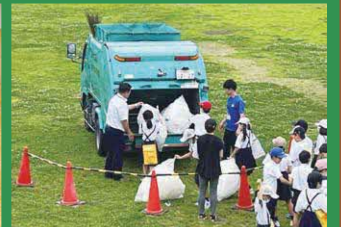
ごみ収集車にごみを入れる体験をしました