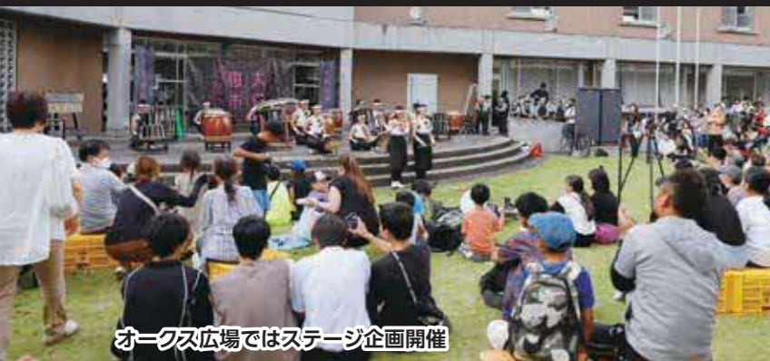
オックス広場ではステージ企画開催