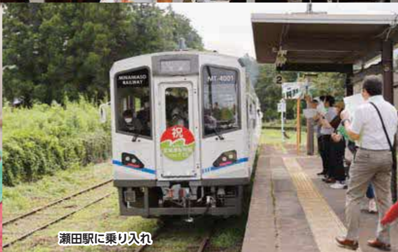
瀬田駅に乗り入れ