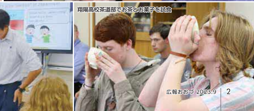
翔陽高校茶道部でお茶とお菓子を試食