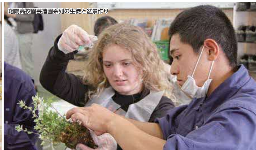
翔陽高校園芸造園部の生徒と盆景作り