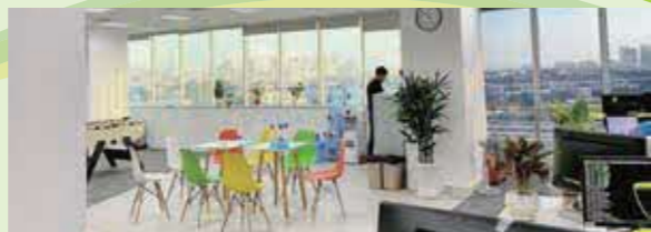
ベトナム拠点（ホーチミン市）