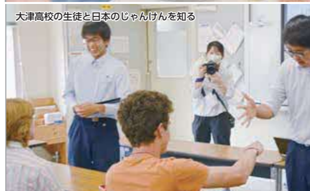
大津高校の生徒と日本のじゃんげんを知る