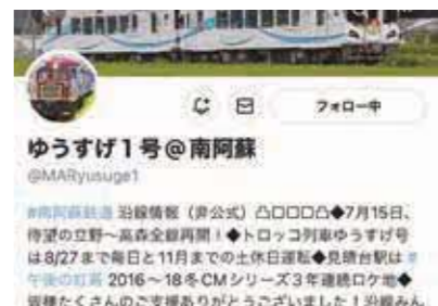
▲桃根さんが情報発信するXのアカウント ゆうすげ1号@南阿蘇 (@ MARYusuge1)