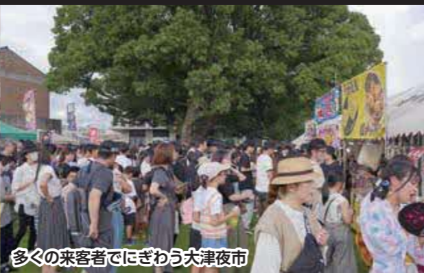
多くの来客者でにぎわう大津夜市