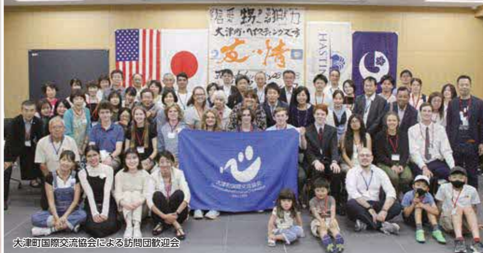
大津町国際交流協会による訪問団歓迎会