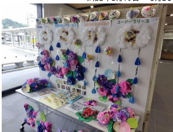
<こころす&コージーブリーズ>