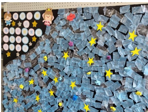
<若草学園(若草児童学園・児童発達支援センターおひさま)>