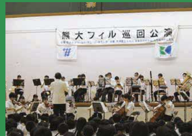
熊本大学フィルハーモニーオーケストラによる公演

楽器体験コーナーでは、バイオリンなどの楽器に触れました。実際に触れた児童は「難しかったけど、いろんな音が出て楽しかった」と笑顔で話していました。