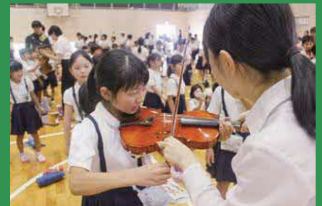
実際にバイオリンに触ってみました