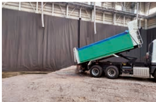
最終処分場の残余年数が重要