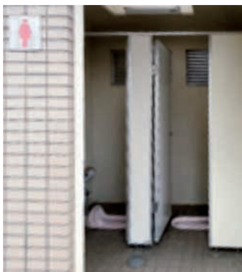
かぶとむし公園の女子トイレ(和式のみ)