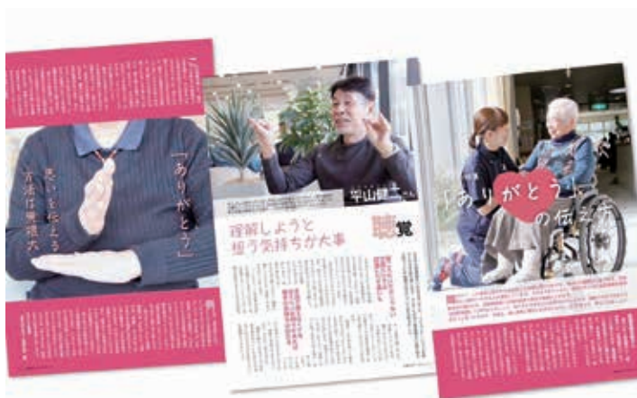
「やさしさの特集」ありがとうの伝え方を掲載した広報おおづ

Q 大津町では、手話の普及啓発活動が積極的に進められており、手話が着実に広がっている。現在、障がい者基本計画の見直しを行っているが、その計画を具体的に推進していくとともに、幅広い理解を深めていくためにも、手話言語条例の制定が必要だ。また、条例の制定と合わせて手話講座を開催していくことが重要だ。