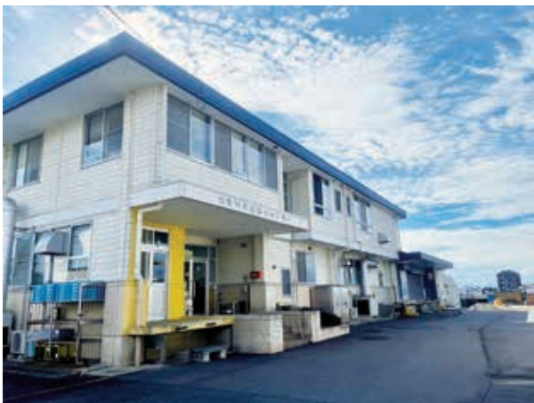
学校給食センター