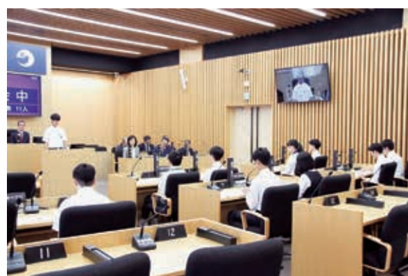
威風堂々たる充実した質問は答弁に必ず反映される

Q ジュニアリーダー夢議会で学生議員が質問を行った。関心を持つ話題や学習の成果をエビデンスとして練り上げられ、素晴らしい政策提言だ。これらの提案を行事として終わらせるには誠に惜しく、政策に反映すれば、こどもたちの意思尊重にもつながる。こども基本法ではこどもや若者に関する政策を決める際、こどもや若者の意見を聞くことが、国と全ての自治体の義務だ。