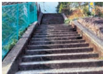
美咲野 1丁目の階段