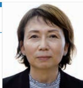
さんのみや みか 三宮 美香議員