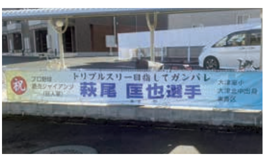
楽善区が作成、掲示する横断幕

◎ 世界大会以外でも 作成に値するものもあ る。臨機応変に対応でき る体制をお願いする。