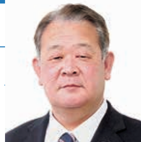
とよせ かずひさ 豊瀬 和久議員