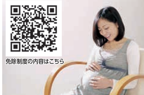
免除制度の内容はこちら

Q 国民健康保険税の減免申請を出産被保険者が申し出る際、妊娠した人に負担がかからないようワンストップサービスのような対応は出来るか。