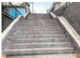
美咲野 3丁目の階段