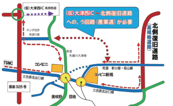
美咲野交差点に大型トラックなどの車両が集中して非常に危険

美咲野交差点（通称） 現在4差路の交差点は美咲野団地が開発されるまで3差路でした。歴史的名称として「桜山交差点」と呼ばれていた。付近に桜の木がたくさん植栽され、町の人の花見でにぎわっていたと記録されている。