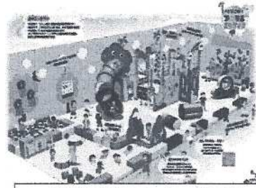
多世代交流センター憩の家のキッズスペース（イメージ）