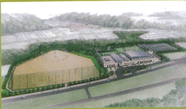
施設全景のイメージ