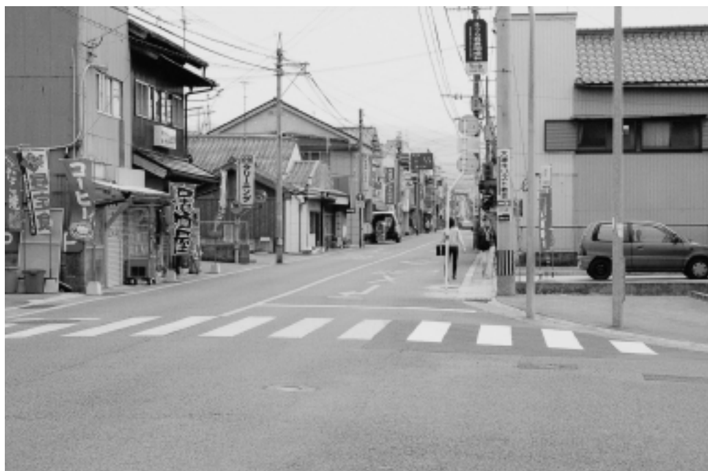
商店街の活性化はあるか