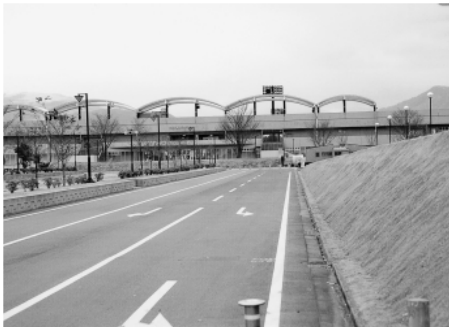
運動公園北側に駅新設は可能か？