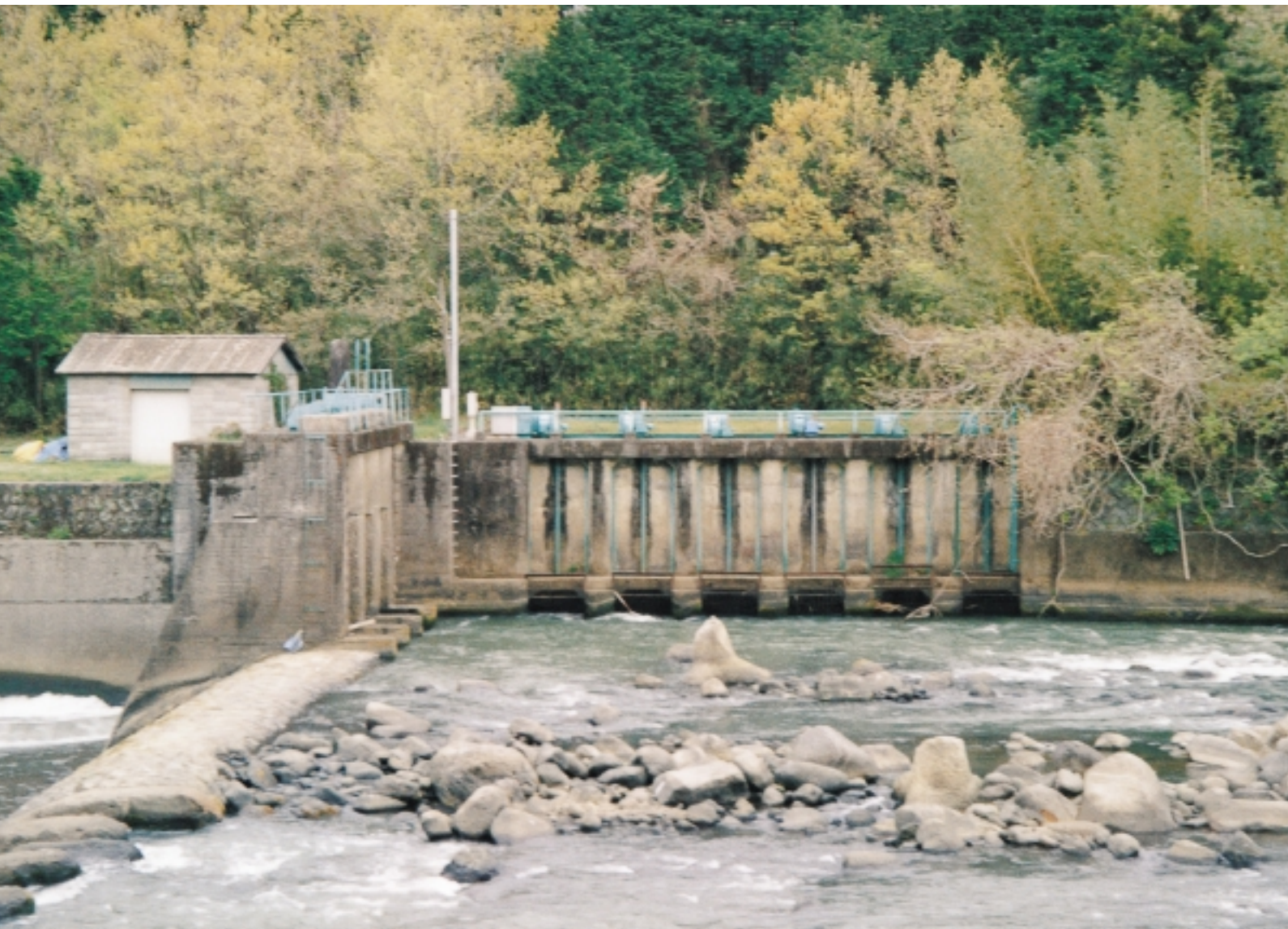
歴史的な上井手頭首工（白川より取水口）