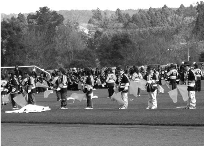
元気いっぱい幼年消防クラブ