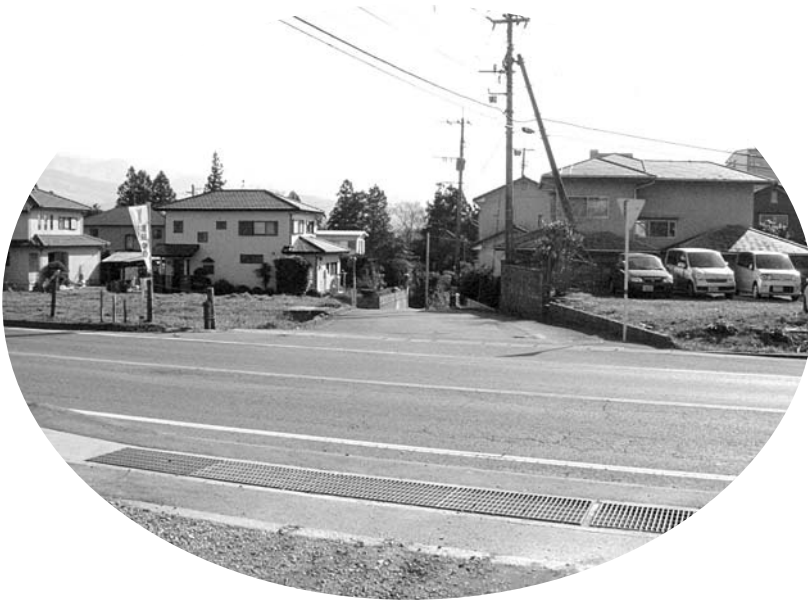
国道57号線、吹田団地東側交差点