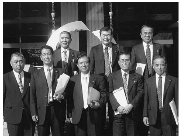
埼玉県八潮市で研修

PFI事業方式で中学校校舎と公共施設を建設する計画。PFI事業は民間業者の工夫や競争原理を生かすということだが、市の説明では、工事にかかるまで長い期間や多くの費用がかかるため10億円を超えるような事業でないという期待できないそうである。