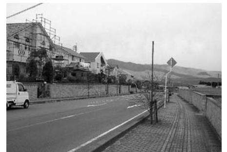
開発がすすむ美咲野団地