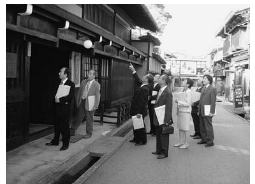
岐阜県高山市・吉島家住宅