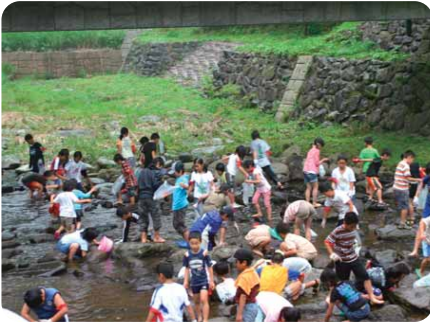
ヤマメのつかみどりに歓声をあげる子どもたち