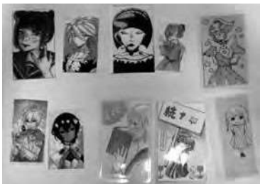
手づくりのしおりは、図書館で本を借りた人にプレゼントします!!