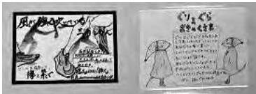
大津高等学校図書委員会の手づくりPOP