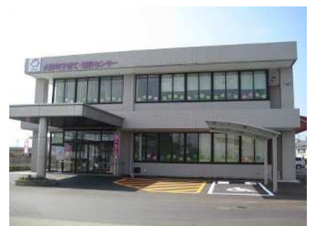
子育て・健診センター

子育て・健診センターと大津中央公園の施設管理のための経費です。主なものは、点検・管理の委託料や光熱水費です。