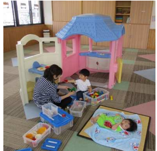
子育て支援センター (子育て・健診センター2階)

子ども・子育て支援新制度は、すべての子どもが笑顔で成長し、すべての家庭が安心して子育てできるように支援する仕組みです。この制度に基づき、子ども・子育て支援事業計画を策定し、計画的に子育て支援を推進しています。