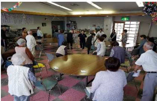
『はつらつ元気づくり事業』の風景

介護保険要支援認定者やチェックリストによる事業対象者へ、日常動作訓練の場や生活支援の援助を行い、高齢者の日常生活の自立のための支援を行います。