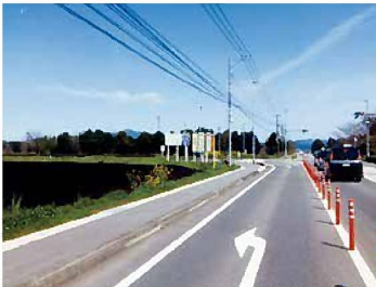
菊陽町 新工業団地予定地

意見 中九州横断道路の整備が進むので、民間と協議し迅速に工業団地の開発を進めてほしい。