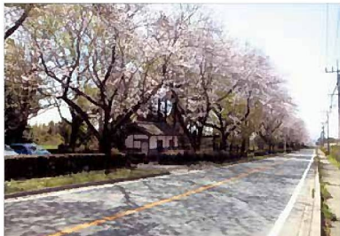
清正公道公園トイレ

A 現在3か所あり、すべての解体を含んでいる。1ヶ所に集約をすること、便器の数も増えたことが影響している。解体は、1棟当たり300万円の3棟で900万円を計上している。