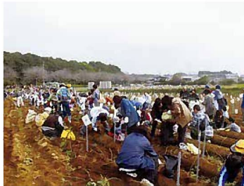
からいもフェスティバル