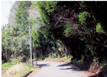
並木が町道を覆う

A 町内在住の方には直接伺い、町外の方には文書でお願いをしている。今後も町道の安心安全のために管理していく。