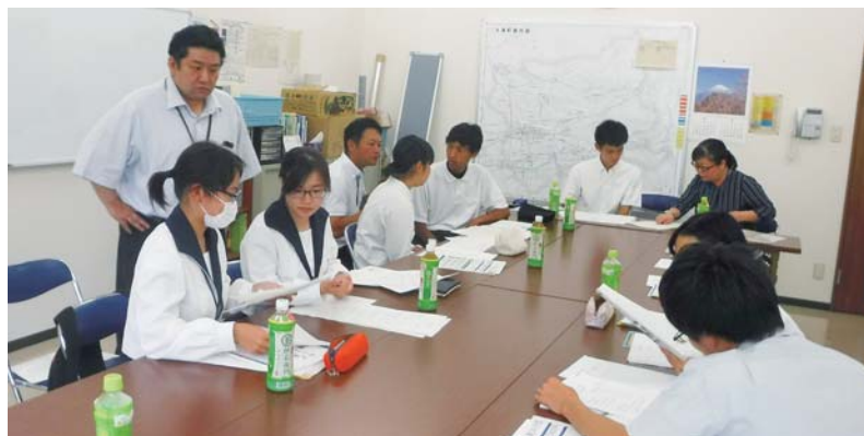
夢議会に向けて真剣に議論する生徒達