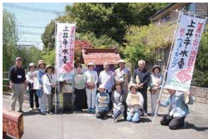
ウォーキング時にのぼり旗を持ってPR

Q 関連事業の進捗状況は。 A 令和元年度の関連事業は、開催地を移しながらのリレーシンポジウムのような形で、熊本市・菊陽町・大津町での実施を考えていて、菊陽町との合同でのシンポジウムを11月、文化の日前後の開催を検討している。