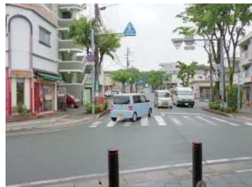
肥後大津駅北口周辺