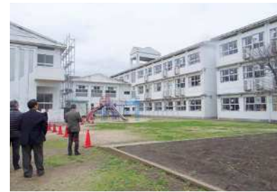
増築予定の小学校

として、部屋を仕切って使用しているところもある。小さい教室を作って対応してほしい。 Q 美咲野小学校は、教室不足は4年で解消する予測でプレハブとなった。 大津小学校は宅地開発が進んでおり長期的に人が増える予測なので増築を考える。特別支援学級については確認して検討する。