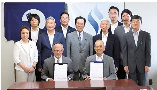
尚綱大学関係者と広報委員（27年6月5日）

政治・議会に対する深い知識を有しない「学生の視点」を取り入れることで、より一層「誰にとっても理解しやすい」議会だよりを目指すとともに、若年層が興味関心を持つきっかけ作りを進めます。