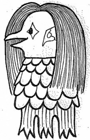
アマビエ (図書館スタッフ作成)