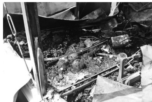
ボールなどの運動用具が全て燃えてしまっています