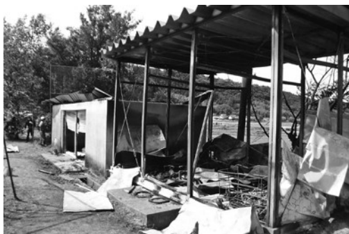
学校は休校のため児童に被害はありませんでした

5月22日未明、大津東小学校のグラウンド西側倉庫から火の気が上がり倉庫が全焼しました。同日実施された警察・消防などによる現場検証では、近くの水田であぜ草の焼却作業があつており、草を刈ったあとに燃やした残り火が出火原因として考えられるとのことでした。その倉庫は体育倉庫として利用されていて、運動会などで利用するテントやボールなどが保管されていました。