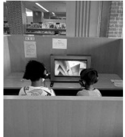
館内で視聴いただくこともできます!